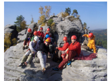
Gipfelglück am Elbsandstein