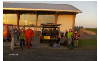
Tourenstart vor dem CVJM-Haus