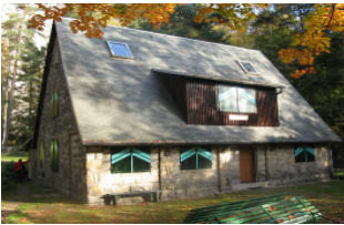
Karl-Stein-Hütte in Rathen

Seit 2006 eine Starke Gemeinschaft für sportliche Freizeitgestaltung in Brandis