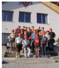
Gruppenbild der Startergruppe im Sommer 2006